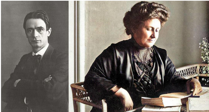
Rudolf Steiner & Maria Montessori.