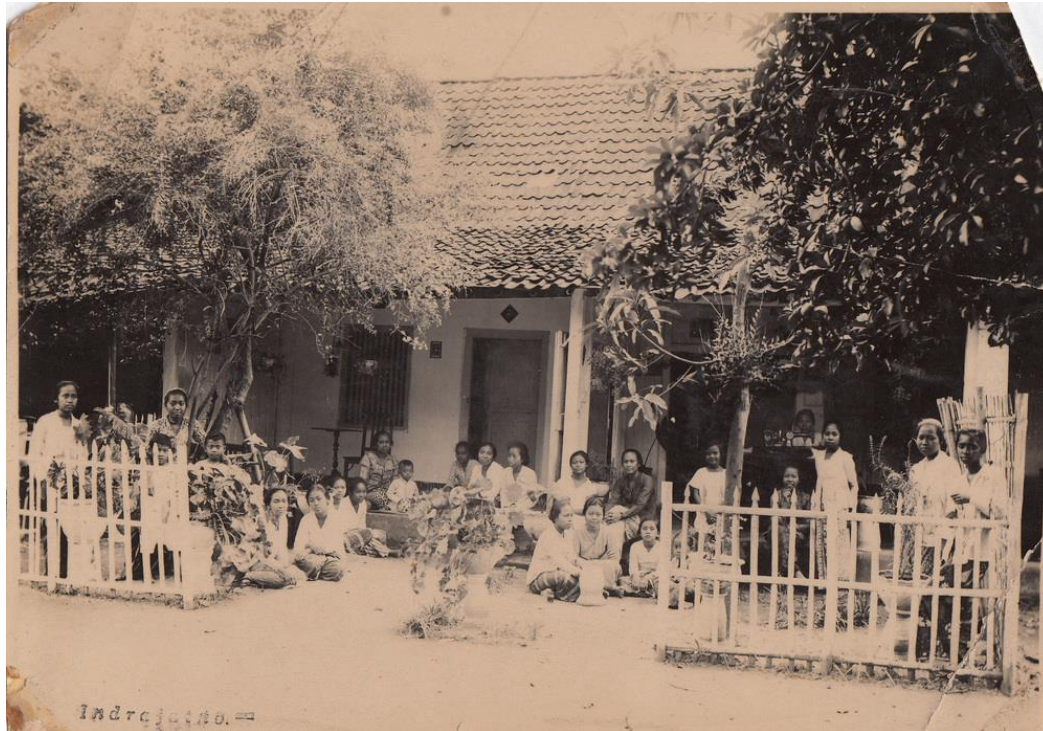
Sekolah Tamansiswa yang pertama di Jalan Gadjahmada.